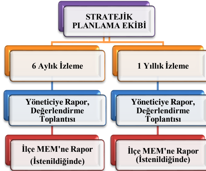
ve Değerlendirme Modeli